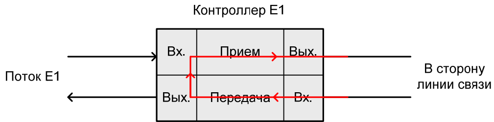
Рис. 3. Шлейфы network и payload