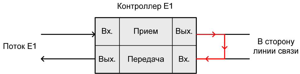
Рис. 2. Шлейф local